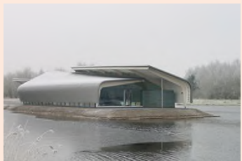
De Verbeelding Zeewolde