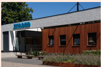
Theater Stroud Putten