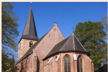
Oude Kerk Ermelo